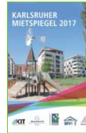
Amtlicher Mietspiegel 2017 der Stadt Karlsruhe